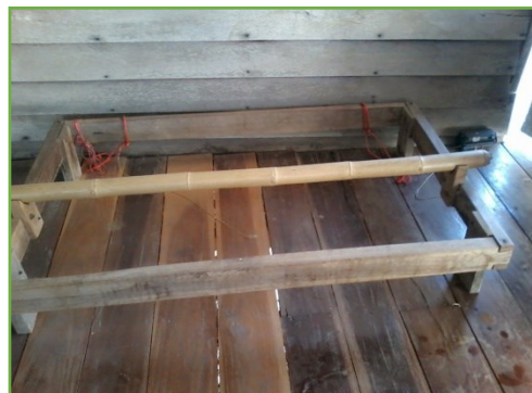
ฟืม/กี่/ไม้สอดกก