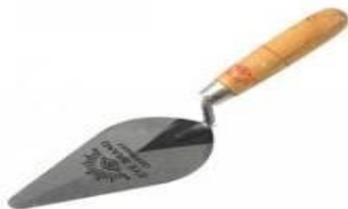
ปูนกาวซีเมนต์